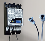
HTP-21C / HTP-21E 進口安全光線